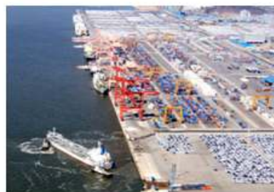
平沢港 (PYEONGTAEK PORT)