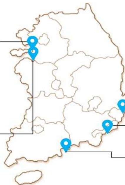
蔚山港 (ULSAN PORT)