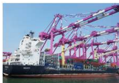
仁川港、仁川新港 (INCHEON PORT)

韓国には約30カ所の貿易港があり、そのうち主要5大港で全国の取扱量の88%を占めています。 - BUSAN PORT, INCHEON PORT, GWANGYANG PORT, PYEONGTAEK PORT, ULSAN PORT